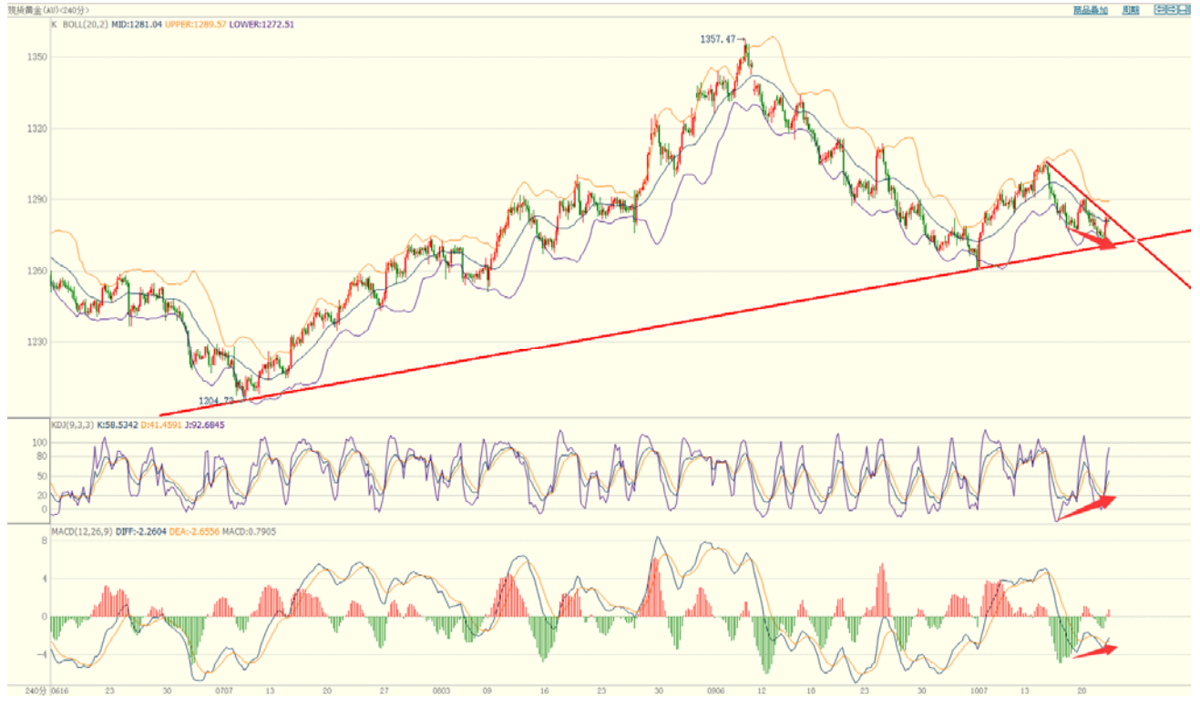
图：银价 4 小时布林走平，短线震荡